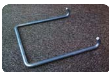
[移動用取手(別売り)]